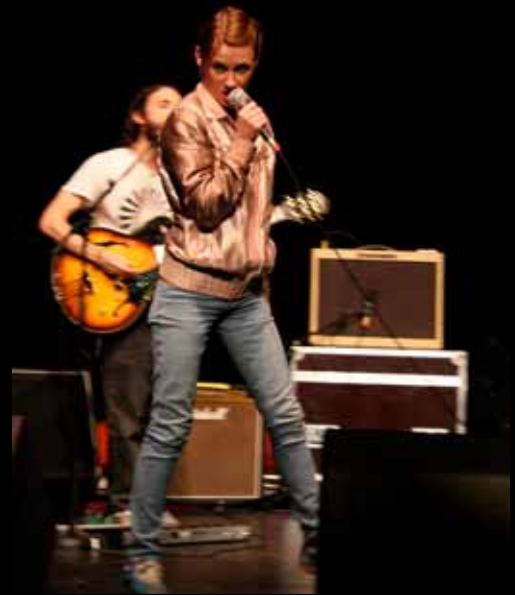
Travail scénique avec le groupe Pilot Sélection Découvertes Printemps de Bourges 2009

Parallèlement à ses activités parisiennes, le Coach organise tout au long de l'année des stages en région et à l'étranger.