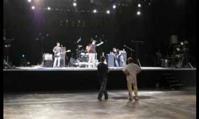
Stage à l'Autre Canal à Nancy juin 2009

→ Vous choisissez les artistes que vous souhaitez accompagner et qui bénéficieront de ce stage